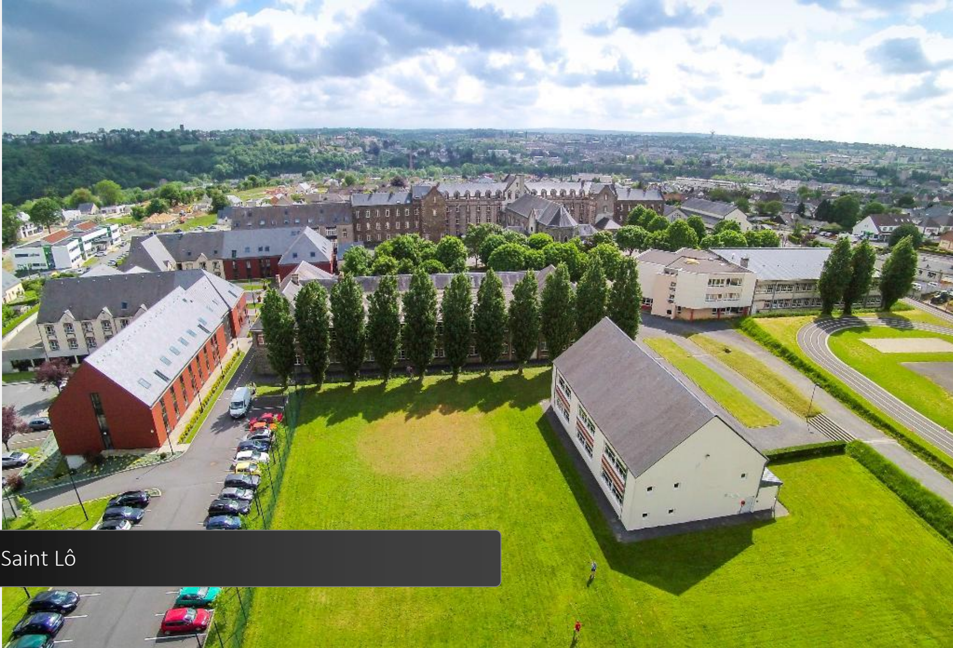
Institut Saint Lô